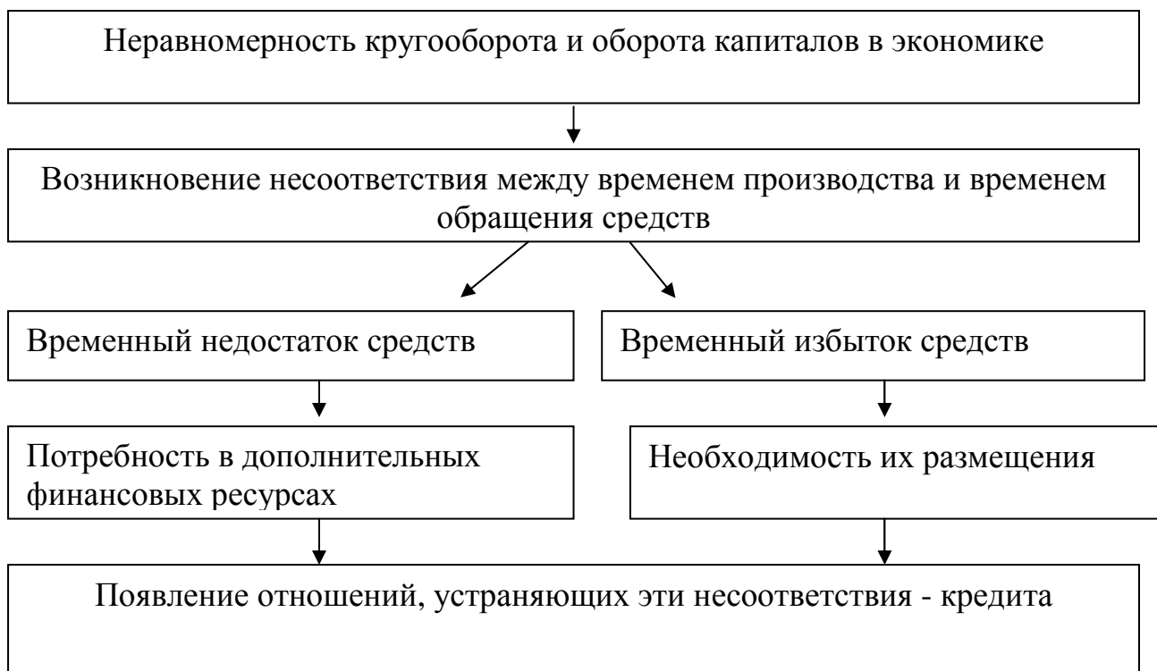
Рис 2. Необходимость кредита в экономике

Необходимость кредита в экономике может быть описана следующим образом: