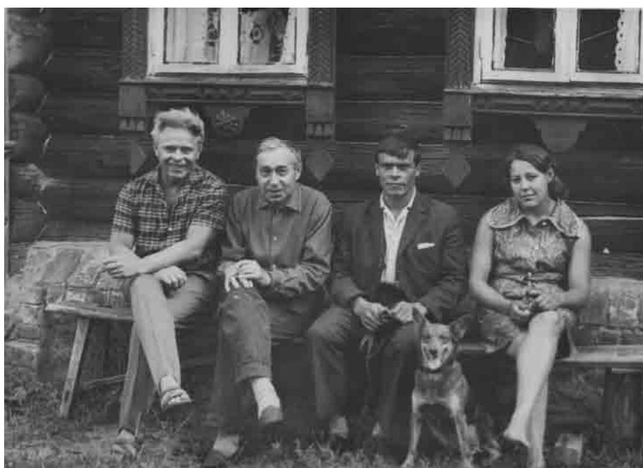
В Крюкове. Друзья. 1973 г.

В общении Годнев был очень простым, доброжелательным, очень любил задавать вопросы собеседнику. Очень ценил юмор и считал, что «юмор – спасательный круг от всех склок».