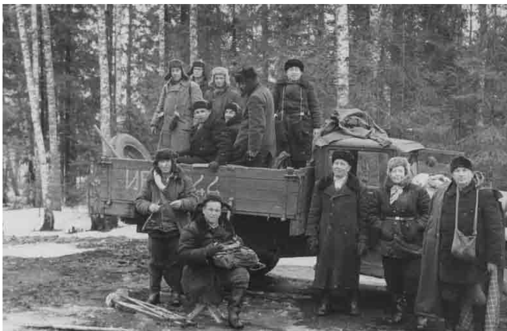
Секция спортивного рыболовства